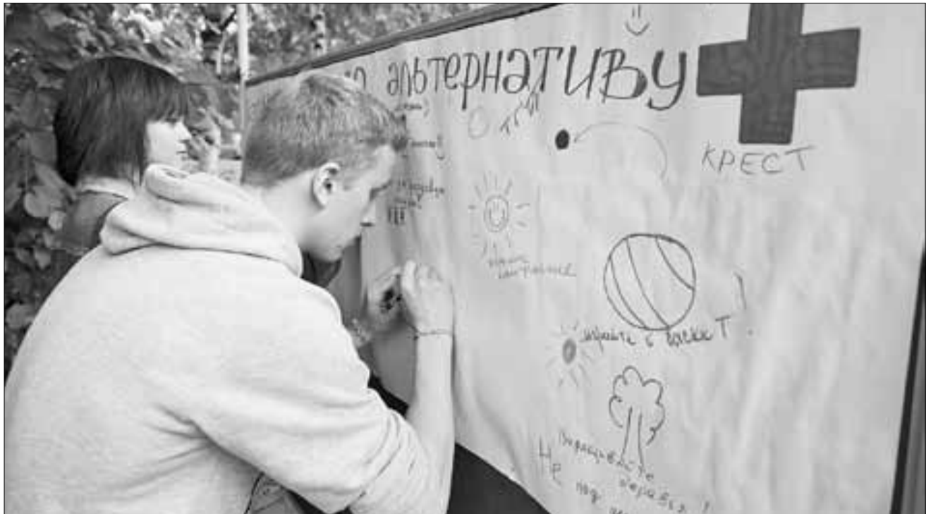
■ Миссия праздника «Молодежный БУМ», который ежегодно проводится в Архангельске на Чумбаровке, – пропаганда здорового образа жизни и борьба с наркотиками.

Необходимо работать и над повышением самосознания населения, ведь традиционная позиция невмешательства, как говорится, «моя хата с краю», просто недопустима, когда речь идет о безопасности и жизни беззащитного ребенка. Да и веками укоренившееся в умах многих русских людей понятие «Бьет – значит любит» не может считаться нормой и свидетельствует лишь об утрате человеческого достоинства, неуверенности в себе, незнании своих прав.