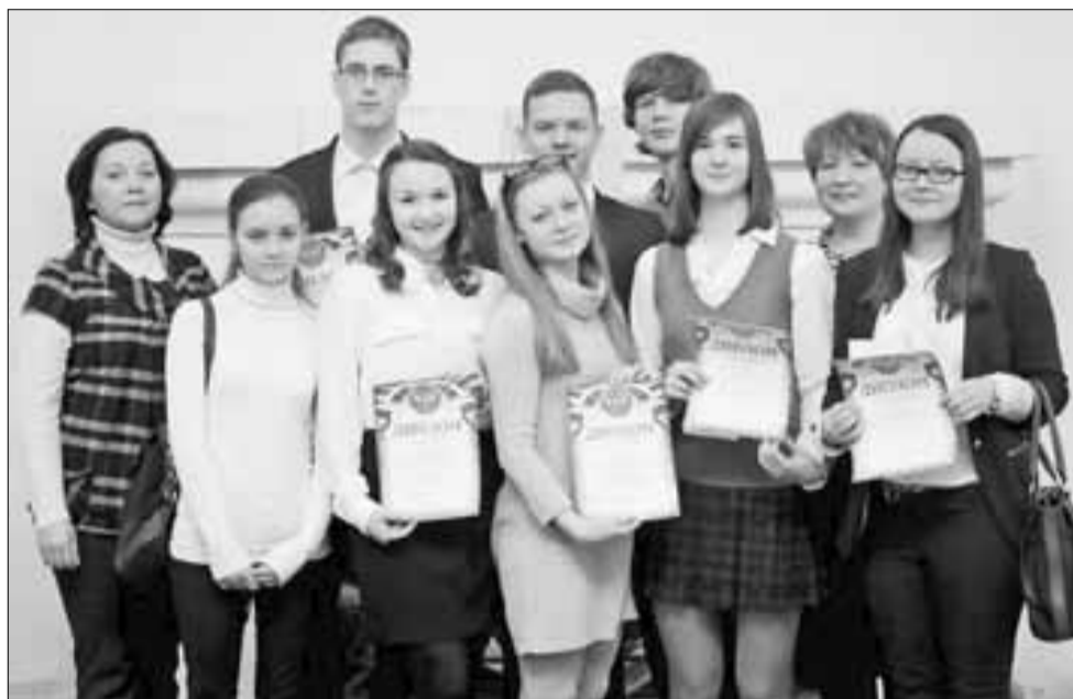
■ На конференцию «Юность Архангельска» собираются талантливые школьники

А музейный фонд Гостиных дворов пополнился еще одним предметом. Свою находку, исследо-